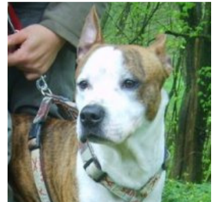
Tierische Bravehearts: Kätzchen Lola und Cattle-dog- Bullmix Baxter warten tapfer auf neue Besitzer